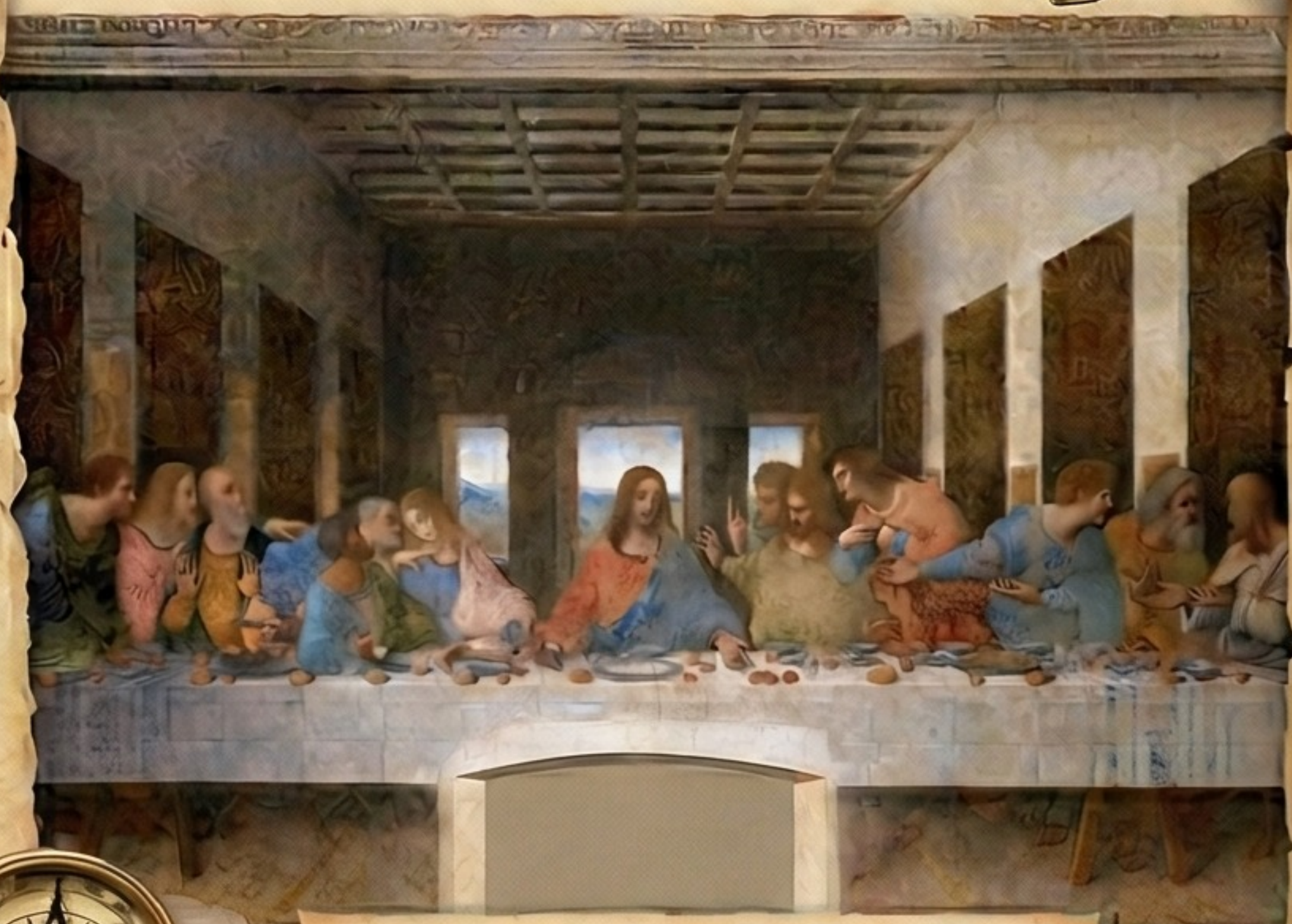
POSLEDNÍ VEČEŘE PÁNĚ